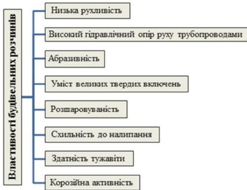
Рис. 1. Особливості будівельних розчинів, що ускладнюють роботу розчинонасосів

Це, насамперед, спроможність розчинонасоса здійснювати сталу подачу по трубопроводах будівельних розчинів різної консистенції. Подача розчинів рухливістю понад 10 см за допомогою розчинонасосів не становить особливих труднощів. Однак вести механізоване соплування до одержання штукатурного шару необхідної товщини такими розчинами практично недоцільно, тому що в цьому випадку необхідно значно збільшувати число проходів і, отже, знижувати продуктивність штукатурних робіт. Крім того, у споруджуваній будинок уноситься значна кількість додаткової вологи, що призводить до збільшення термінів його сушки, суттєво зростають втрати штукатурного розчину, що сповзає з вертикальних стін на підлогу через підвищену його рухливість. Тому сучасні технології проведення штукатурних робіт вимагають використання розчинів рухливістю 9...10 см, а рухливість цементно-піщаних розчинів, які подають по трубопроводах, ще нижча: 7...8 см.